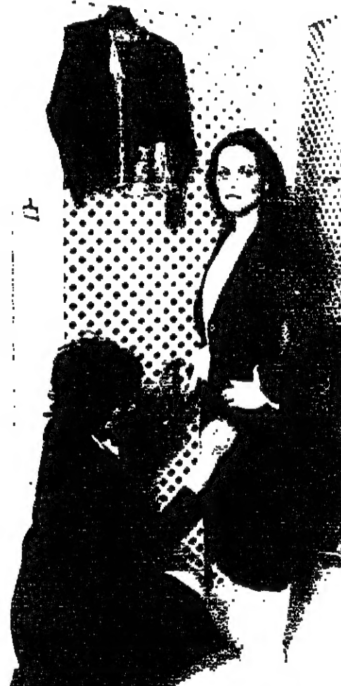
تقف أمام الخياطة لتبالي ثيابها